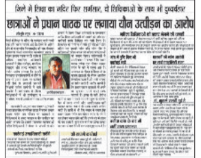
28 नवंबर को हरिभूमि में प्रकाशित खबर।

कार्यालय सभागीय संयुक्त संचालक (शिक्षा), सरगुजा संभाग द्वारा जारी आदेश के अनुसार, जिला शिक्षा अधिकारी आदिवासी छात्राओं के साथ यौन शोषण का प्रयास और मानसिक प्रताड़ना कोई साधारण विभागीय गलती नहीं है, बल्कि यह 'पाँक्सो एक्ट' और 'एट्रोसिटी एक्ट' के तहत एक गंभीर अपराध है। ग्रामीणों ने मांग की है कि विभाग को केवल निलंबन तक सीमित न रहकर पुलिस से गाली-गलौज करना प्रथम दृष्टया सही