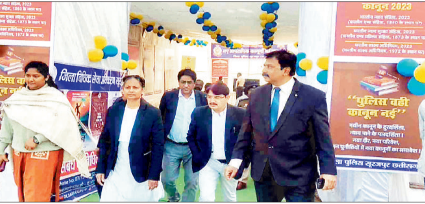
प्रदर्शनी का निरीक्षण करते न्यायाधीश एवं एसएसपी।