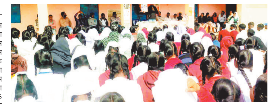
विद्यार्थियों को जानकारी देते अधिकारी।