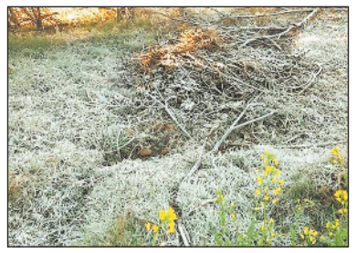
मौसम ने बदली करवट तापमान 5 डिग्री पर लुटका